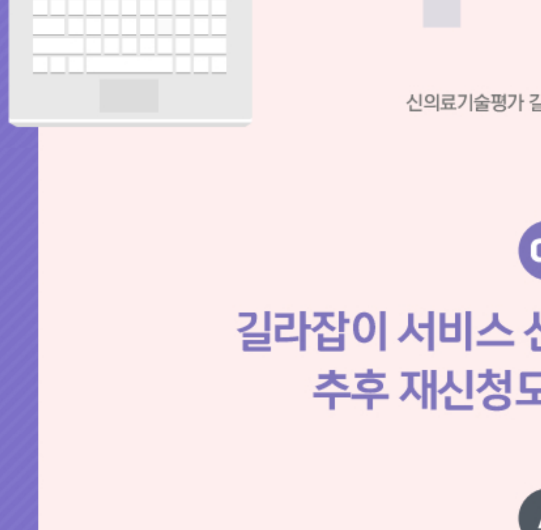
신의료기술평가 길라잡이 서비스 안내

신의료기술평가는 객관적이고 독립적으로 수행되는 평가입니다. 길라잡이 서비스는 자문서비스이기 때문에 신의료기술평가 통과에 직접적인 영향을 주지 않습니다. 다만, 본 서비스를 활용하면 신의료기술로 인정받기 위해 필요한 사항들을 미리 숙지하여 준비할 수 있고, 탈락 기술은 앞으로 보완해야 할 사항을 파악할 수 있습니다.