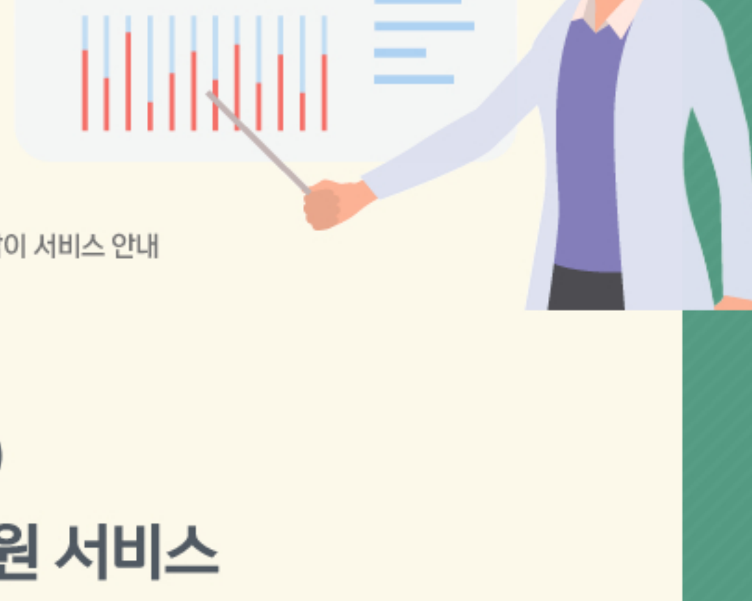
신의료기술평가 길라잡이 서비스 안내