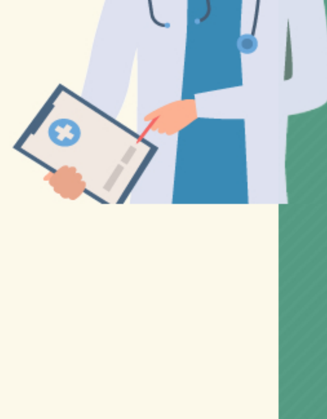
신의료기술평가 길라잡이 서비스 안내