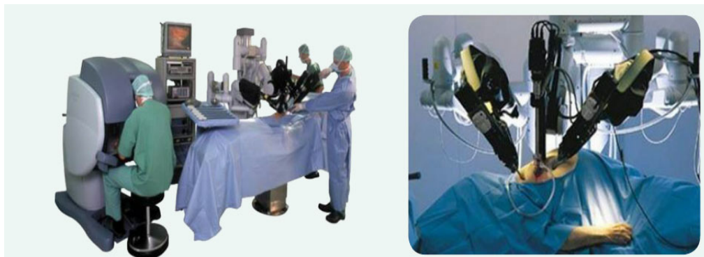
그림 1.1 로봇 보조 수술

의사는 콘솔에 앉아 자동차 운전과 유사하게 내시경 및 기구(instruments)를 조작한다. 콘솔의 조작기(hand control(masters))을 통한 의사의 손동작들(roll, pitch, yaw, insertion, grip)이 기구팁(instrument tips)에 상응하도록 지시하고 조작기를 통한 3D 영상 지원은 눈과 손을 이용하는 개복수술 방식을 재현한다(권오탁, 2019).